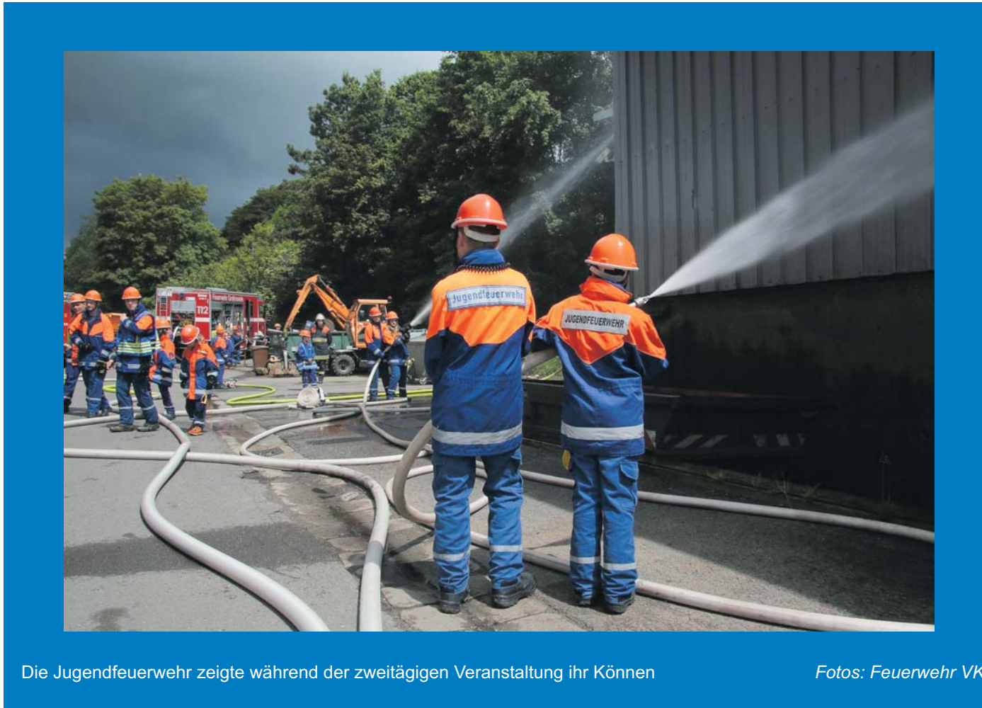
Die Jugendfeuerwehr zeigte während der zweitägigen Veranstaltung ihr Können

Für unverlangt eingesandte Artikel übernimmt die Redaktion keine Haftung.