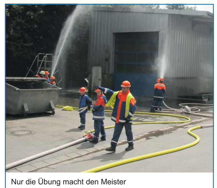
Nur die Übung macht den Meister

Ihr Klaus Lorig Oberbürgermeister der Stadt Völklingen